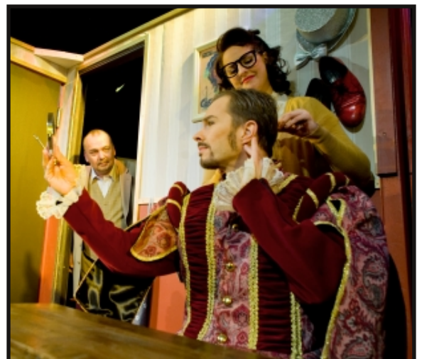
Putte som Petruccio i pjäsen i pjäsen.