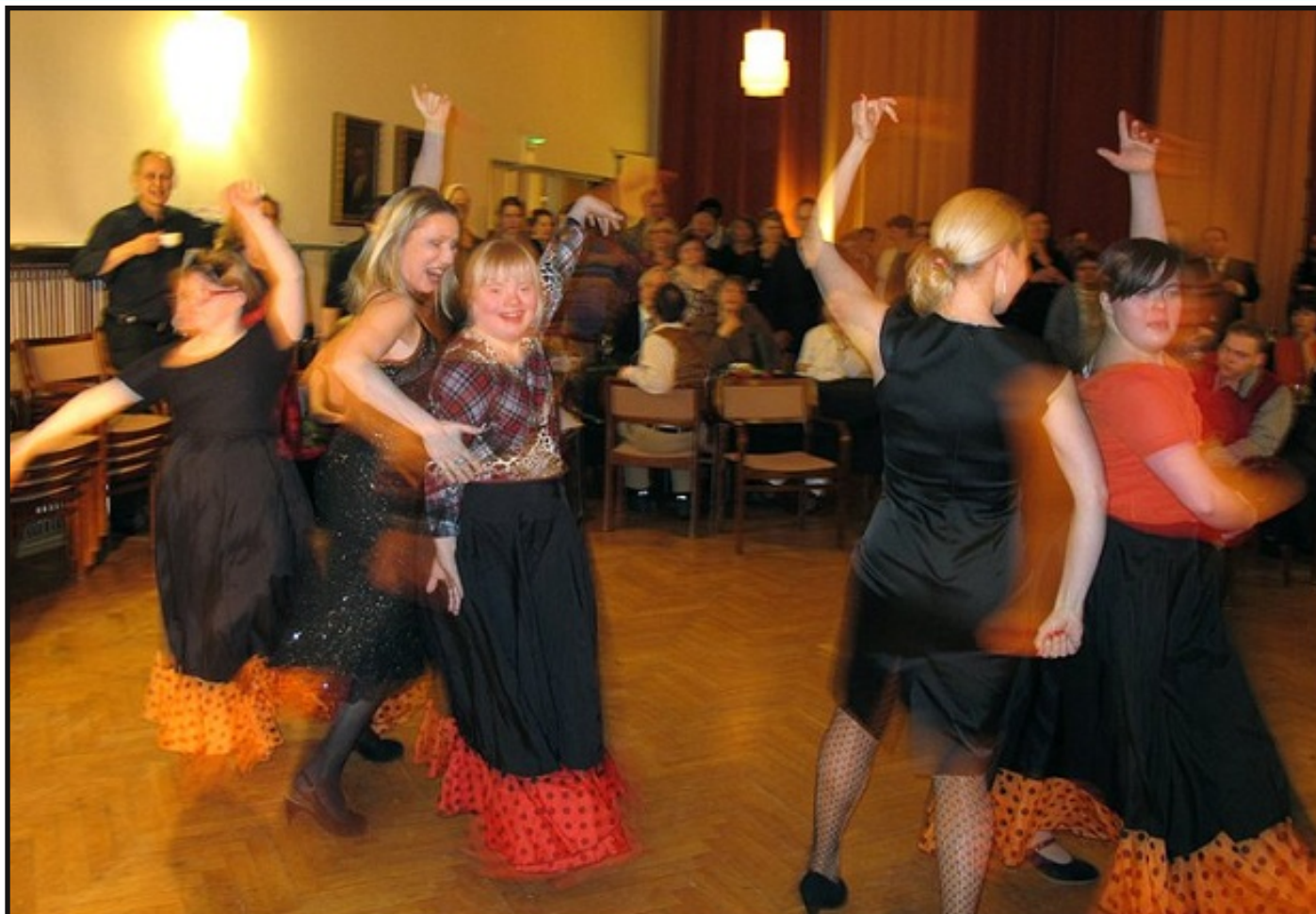
Flamencogänget dansar på DUV teaterns jubileumsfest.

Informationsblad för De Utvecklingsstördas Väl i Mellersta Nyland r.f. Torsdagen den 24.2.2011